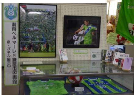
腰越図書館の展示（右）と中央図書館の展示（下）

鎌倉市図書館では、湘南ベルマーレと一緒に応援して、身近に感じてもらえるイベントを、更にはスポーツ・パラスポーツに親しむ本や情報の発信を今後も続けていきます。