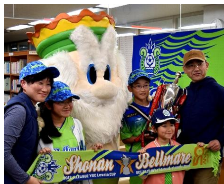
会場に一番乗りしてくれたベルサポファミリー

会場には、市内図書館で巡回展示した品々も。ルヴァンカップ優勝の記念写真、湘南ベルマーレ選手の写真パネル、サイン入りユニフォームなどです。決勝戦で使ったサイン入りボールには、選手が蹴った時の傷も付いていて、臨場感があります。