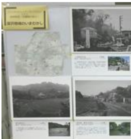
11.1～地域発見！パネル展示