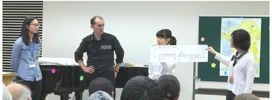
11.3 フランスってどんなくに？