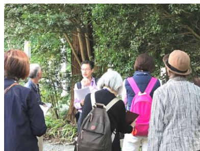
左:妙本寺 説明風景 下:J:COM の放映画像