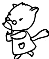
りす もも りす こ 子さん