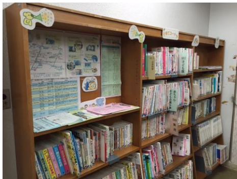
（深沢図書館の子育て情報コーナー）

各図書館では、児童コーナーの中に子育て情報コーナーを作り、子ども服や離乳食、子育ての本などを集めたり、子どもの本に関する書籍やむかしばなし絵本を別置するなど、工夫しています。