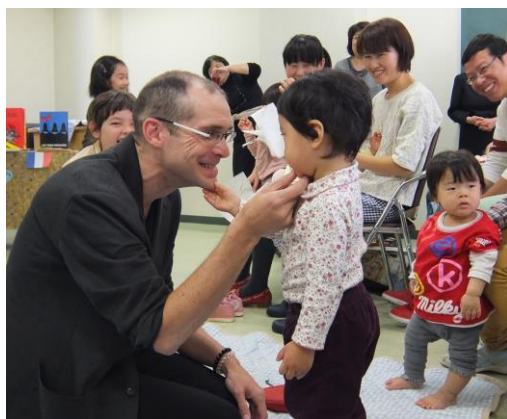
(世界のわらべうた大会)