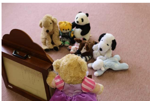
(ぬいぐるみのおとまり会)