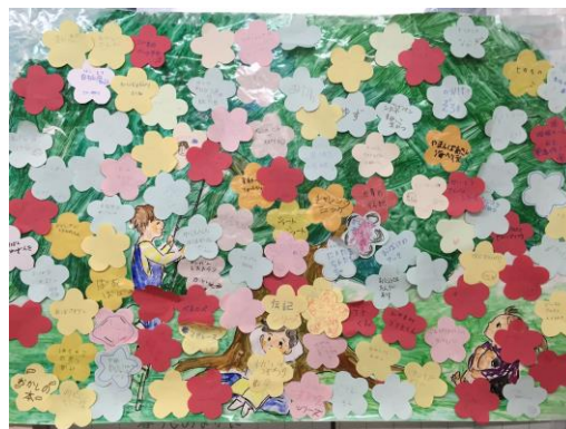
(たくさん咲いた子ども本の木)

毎年、大きな模造紙に、本の木や本の空を作成し、色紙の花びらや洗濯物や星などに自分の好きな本を書いてもらったりして各館で工夫しながら企画しています。同時に図書館で本を探すクイズを行い、普段は手に取らない本をきっかけにして手にとってもらうことも目標の一つです。