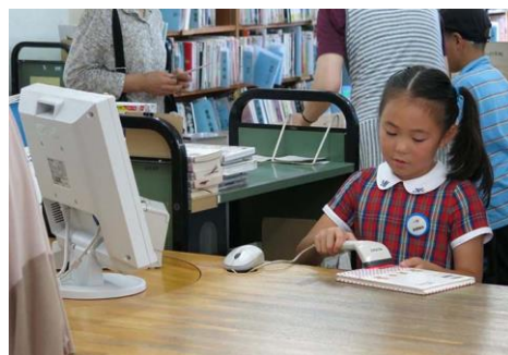
(としょかんいんになってみよう)