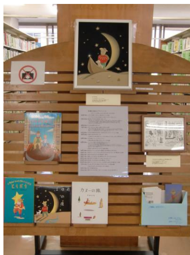
(伊藤正道氏原画展 F☆L104)