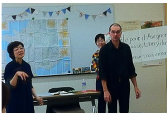
（フランス語でたのしむおはなし会）

なお、各館で利用者の方にお使いいただけるインターネット環境がありますので、インターネットを使いながら、母語に触れていただくこともできるようになっています。