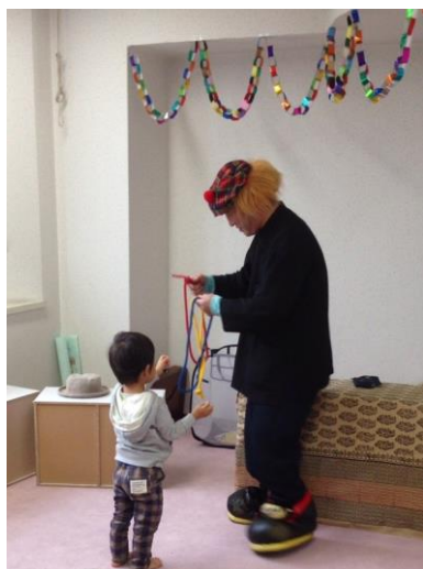
(なにか?ふしぎな!おはなしかい)