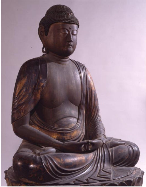
阿弥陀如来坐像(鎌倉国宝館蔵)

鎌倉国宝館では3月10日(土)から特別展「仏像入門」を開催します。仏像鑑賞をさらに楽しく、より親しんでいただくために、仏像の造られた背景や仏像造りの様々な手法についてもお話します。ナビゲーターは鎌倉国宝館学芸員です。