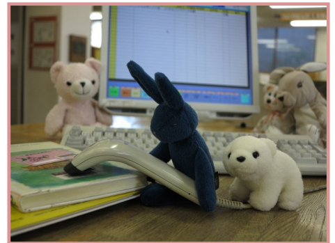
★「ぬいぐるみのおとまりかい」の様子

文字・活字文化の日から始まる秋の読書週間にあわせて行う図書館まつり「ファンタスティック☆ライブラリー」も5年目。図書館開館101年目の秋、「オトナ図書館体験隊」「ぬいぐるみのおとまりかい」「もちより読書会」など新企画も続々登場しました。