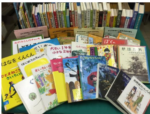
（「よんでみない？おすすめの本」で紹介した本）