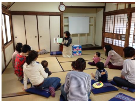
（材木座地区社会福祉協議会： 赤ちゃん広場での訪問サービス開催）

平成28年度主な訪問先実績：だいいち子どもの家、材木座地区社会福祉協議会（赤ちゃん広場）、せきや子どもの家、障害児活動支援センター、わくわくクッキングなど