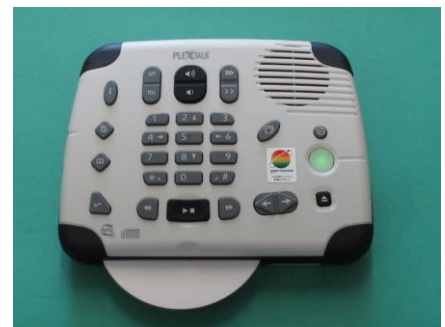
デイジー再生機 「プレクストーク」

尚、CDの一覧はWEBにもあります。 窓口は中央図書館（25-2611）です。 お気軽にお問い合わせください。